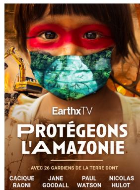
PROTÉGEONS L'AMAZONIE (2021)