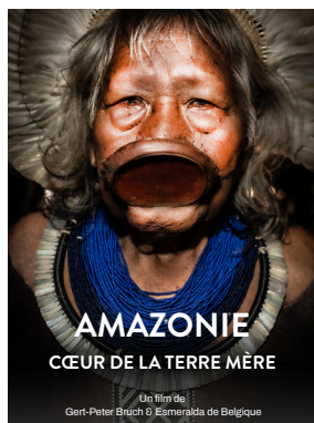
AMAZONIE, CŒUR DE LA TERRE MÈRE (2023)